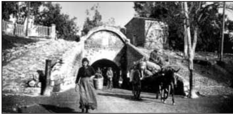
← ΦΩΤ. Α

5.3. Εντόπισε διαφορές και ομοιότητες ανάμεσα στο πώς φαίνεται η πύλη σήμερα και πώς ήταν στο παρελθόν. Κοίταξε, πιο συγκεκριμένα, τη φωτογραφία «Α».