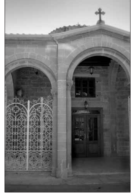
binanın batı yanı