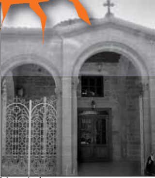
binanın batı yanı

Ermou Sokağı'na geri dönün ve Minoos Sokağı'nın köşesini bulana kadar yürüyün. Hrisaliniotisa Sokağını bulana kadar Minoos Sokağı'nda yürüyün. Zemenides Evini geçin ve sağa dönün. Tam önümüzde Hrisaliniotisa Kilisesi vardır (Bu kilise Bakire Meryem Ana'ya veya 'Bizim Altın Keten Anamız' a ithaf edilmiştir).