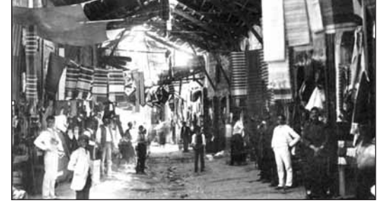
Resim 2: Ermou sokağındaki eski Pazar-20 yy başları.

Eski zamanlarda bu sokakta Kıbrıs danteli, Prusya ve Fransız ipek kumaşları ve İngiliz pamuğu alabilirdiniz.